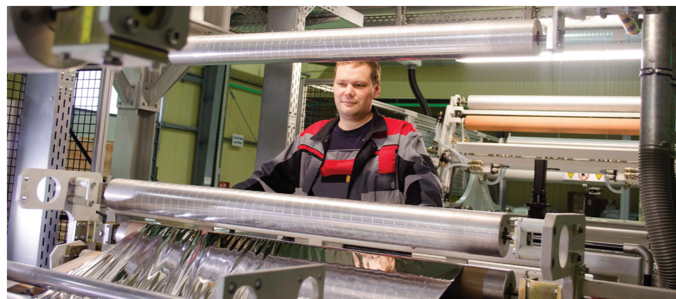
Производство отражательной теплоизоляции ПЕНОФОРМ®