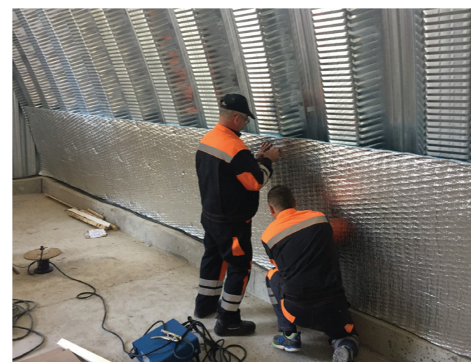
Монтаж отражательной теплоизоляции ПЕНОФОРМ® тип В толщиной 30 мм к внутренней поверхности бескаркасного ангара

В рамках работы в Техническом Комитете 144 «Строительные материалы и изделия» действующем при Министерстве промышленности и торговли РФ, по Программе Национальной Стандартизации на 2018-2020 год, «Заводом ЛИТ» совместно с НИИСФ РААСН был разработан национальный стандарт ГОСТ Р 58795-2020 «Материалы теплоизоляционные отражательные с облицовкой из алюминиевой фольги. Общие технические условия.»