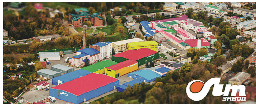
Завод ЛИТ – производственная площадка

Строительная отрасль России, а значит и вектор дальнейшего развития государства, формируются благодаря единому, сплоченному механизму взаимодействия всех участников рынка - от производителя до строителя. Координацию строительной отрасли в нашей стране 30 лет успешно возглавляет объединение Российский Союз Строителей (РСС), которое отмечает в этом году юбилей своего образования.